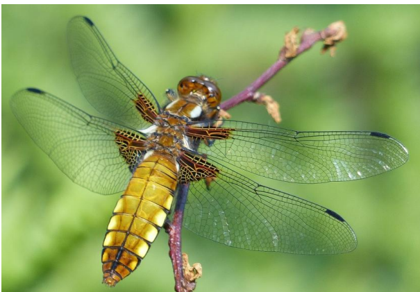
Libellula depressa Plattbauch