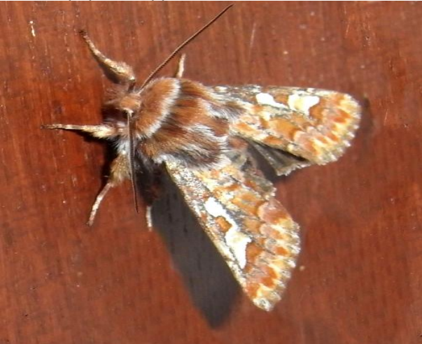
Panolis flammea Forleule