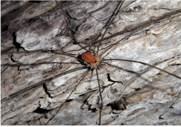
Opilio spec. Weberknecht