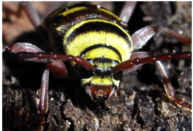
Plagionotus detritus Bunter Eichen-Widderbock