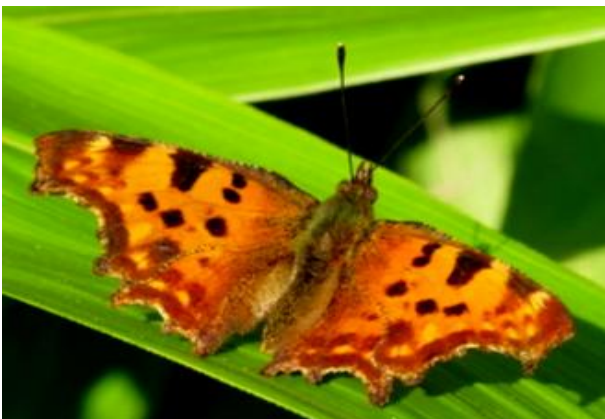
Polygonia c-album Weißes C