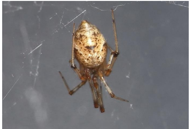
Achaearanea tepidariorum Gewächshauspinne