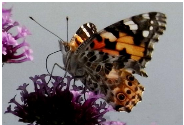
Vanessa cardui Distelfalter