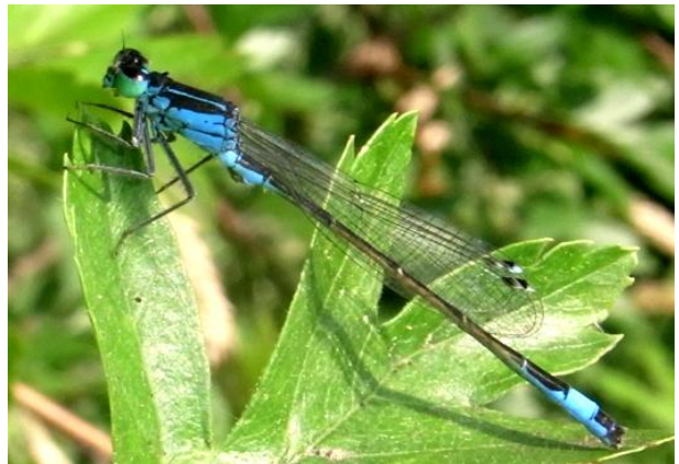
Ischnura elegans Große Pechlibelle