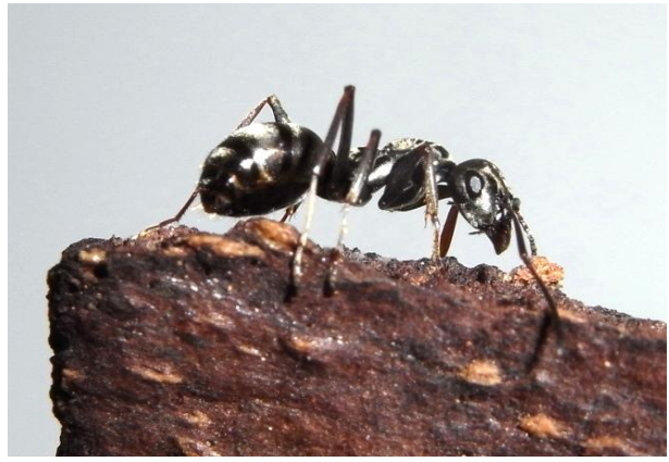
Formica fusca Grauschwarze Sklavenameise