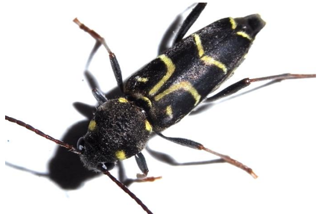
Xylotrechus antilope Zierlicher Widderbock