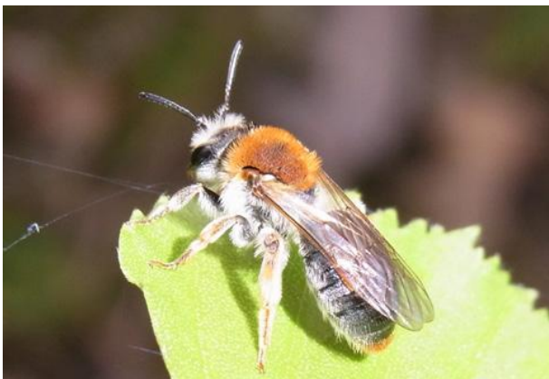
Andrena haemorrhoa Rotschopfige Sandbiene