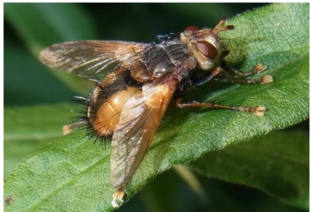
Tachina fera Igelfliege