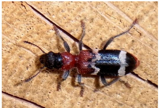
Thanasimus formicarius Ameisenbuntkäfer