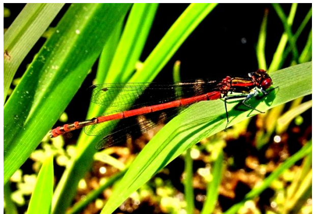
Pyrrhosoma nymphula Frühe Adonislibelle