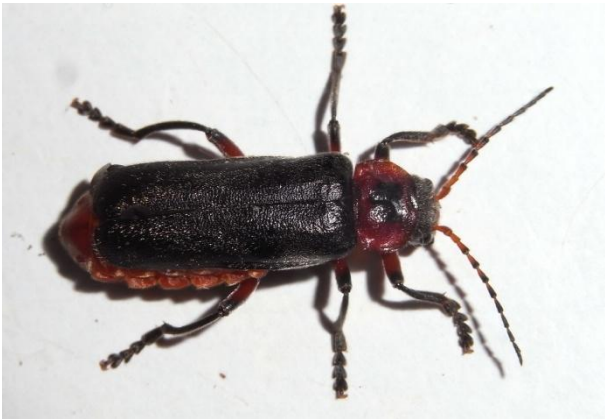
Cantharis fusca Gemeiner Weichkäfer