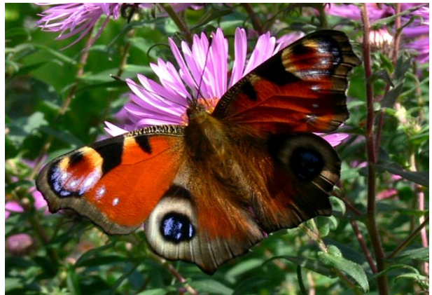
Inachis io Tagpfauenauge