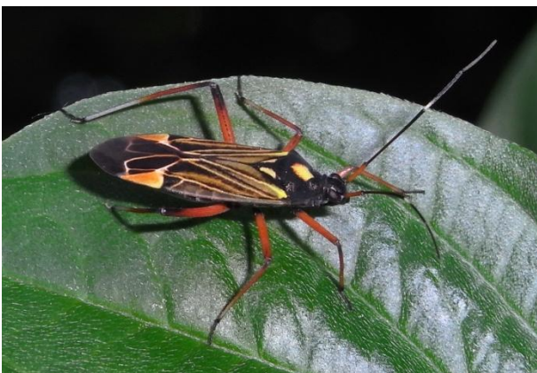
Miris striatus Prachtwanze