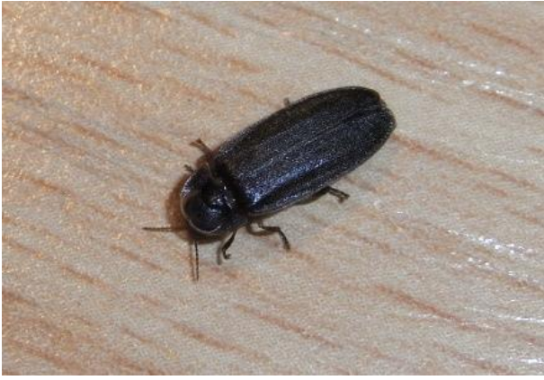
Lamprohiza splendidula Kleiner Leuchtkäfer