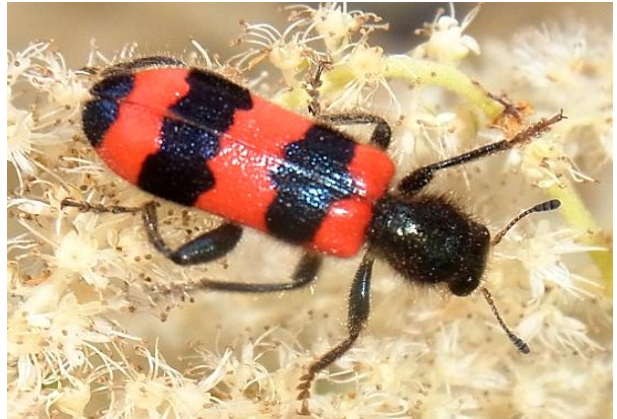
Trichodes apiarius Bienenwolf