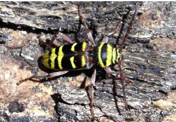
Plagionotus detritus Bunter Eichen-Widderbock