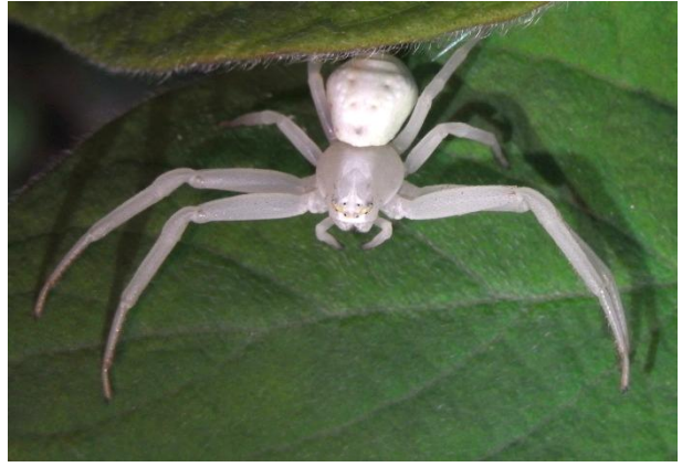
Misumena vatia Krabbenspinne