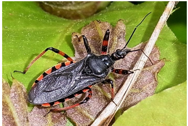
Rhynocoris annulata Geringelte Mordwanze