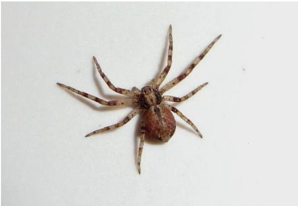
Philodromus cespium ♀ Braune Laufspinne