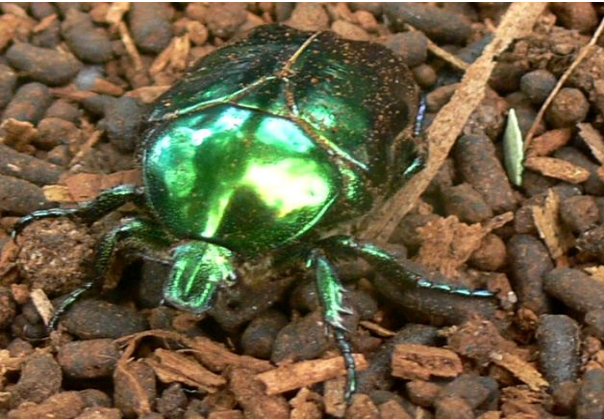
Protaceia aeruginosa Großer Goldkäfer