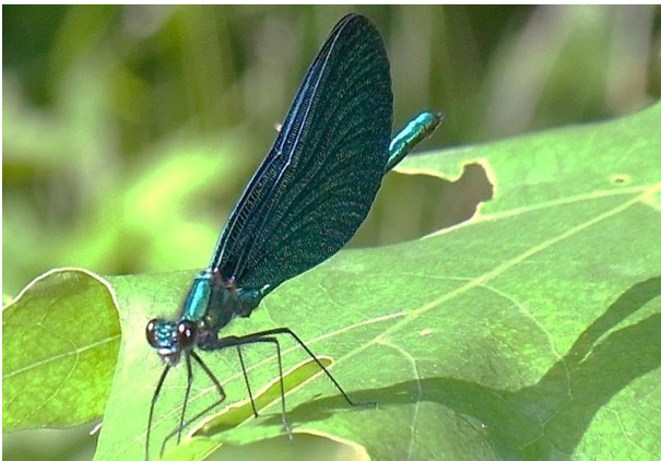
Calopteryx virgo Prachtlibelle