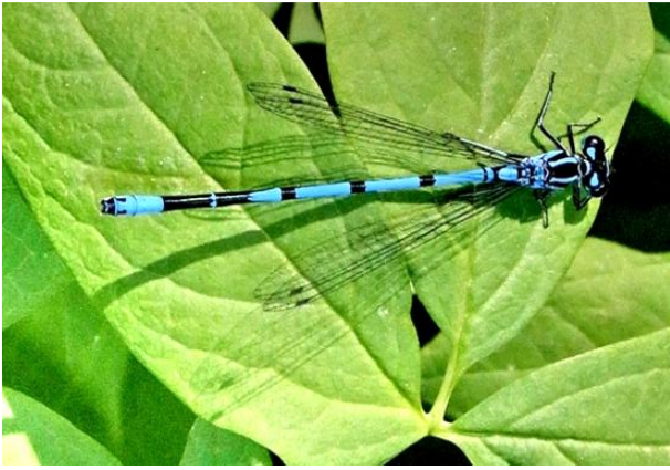
Coenagrion puella Hufeisen-Azurjungfer