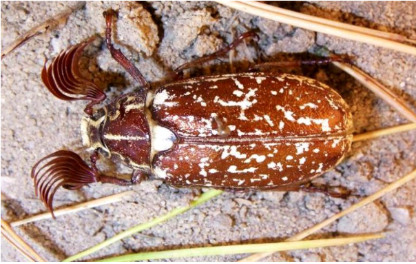
Polyphylla fullo Walker