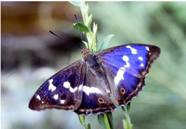
Apatura iris Großer Schillerfalter