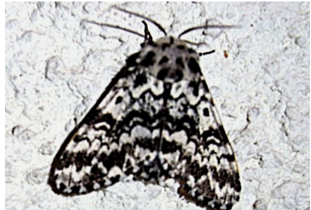
Lymantria monacha Nonne