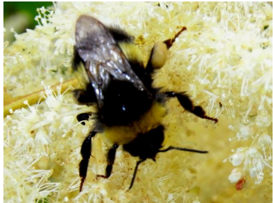
Bombus lucorum Helle Erdhummel