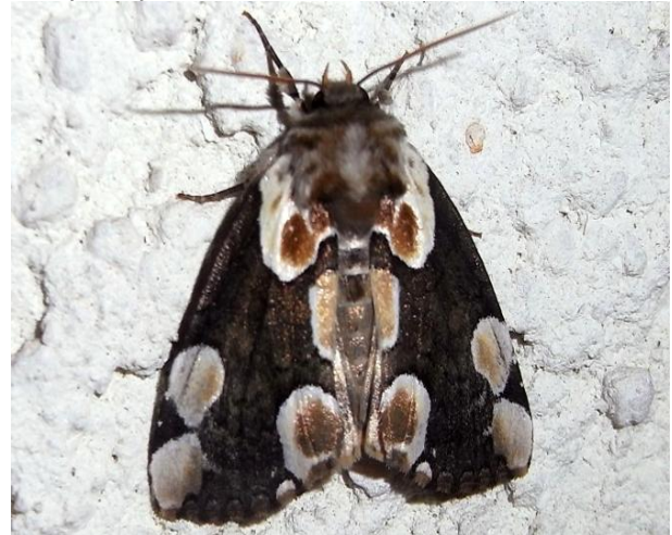
Thyatira batis Roseneule