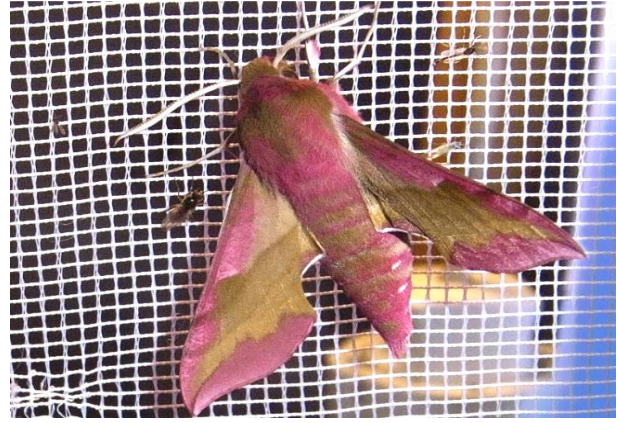
Deilephila porcellus Kleiner Weinschwärmer