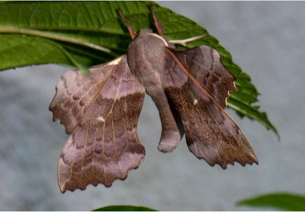
Laothoe populi Pappelschwärmer