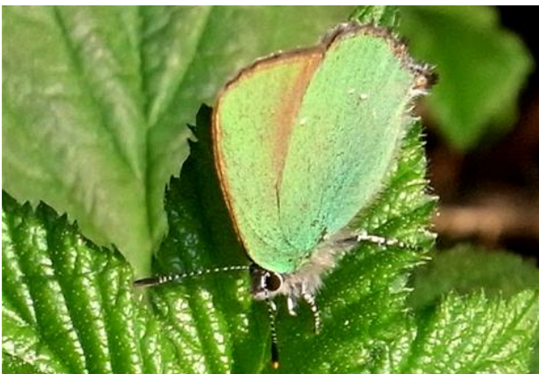
Callophrys rubi Brombeerzipfelfalter