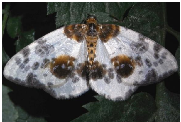
Abraxas sylvata Ulmen-Fleckenspanner