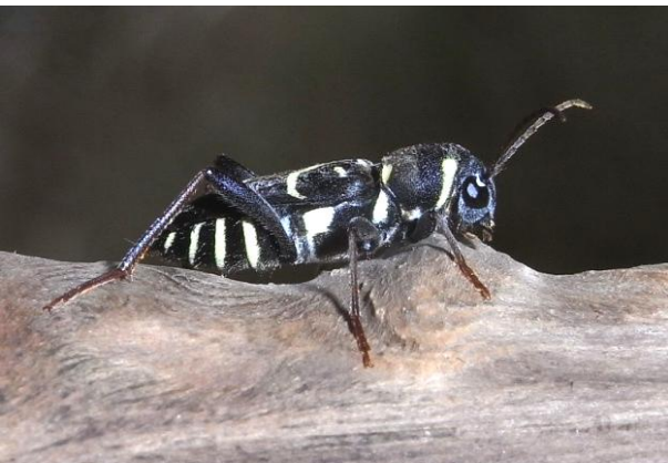
Xylotrechus antilope Zierlicher Widderbock