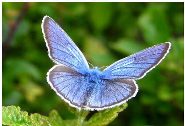
Polyommatus icarus Hauhechelbläuling