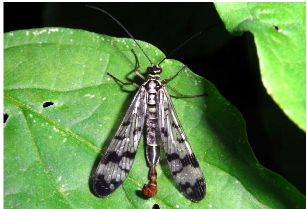
Panorpa communis Gemeine Skorpionsfliege