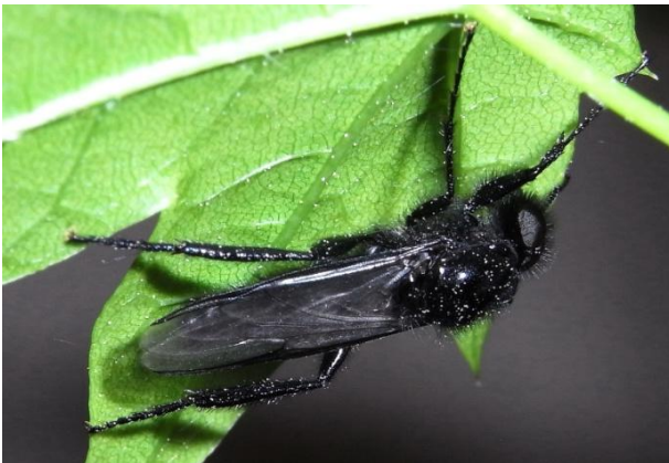
Bibio marci ♂ März-Haarmücke