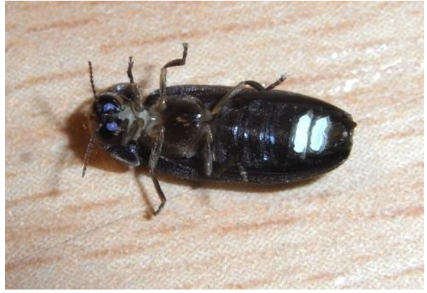
Lamprohiza splendidula Kleiner Leuchtkäfer