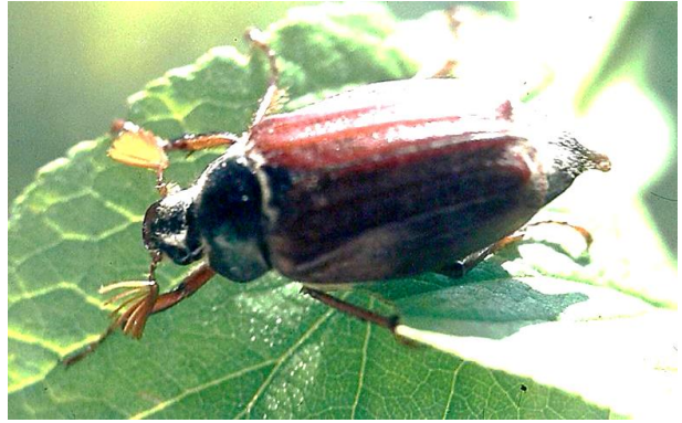
Melolontha melolontha Feld-Maikäfer