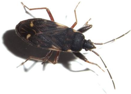
Eremocoris fenestratus Bodenwanze