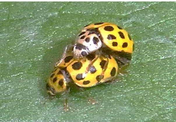
Psyllobora vigintiduopunctata 22-Punkt-Marienkäfer