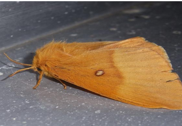
Lasiocampa quercus Eichenspinner