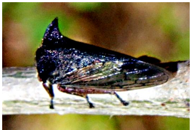
Centrotus cornutus Dornzikade